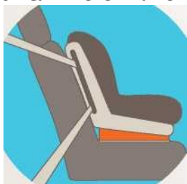
Лицом по ходу движения

Самое безопасное место для установки детского кресла в автомобиле - среднее место на заднем сиденье. Самое небезопасное - переднее пассажирское сиденье и на него автокресло ставится в крайнем случае, при обязательно отключенной подушке безопасности.